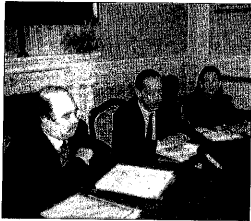
Il-Ministru Lawrence Gonzi jkellm lill-media dwar il-proġett ta' għajnuna għal djar perikolużi

Għal din l-iskema jikkwalifikaw kemm inkwilini fi djar b'kera kif ukoll sidien u anke dawk fi djar li jagħgu taht il-Joint Office.